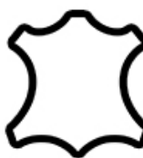
Piei cu fata naturala Leather Cuir Cuero Leder