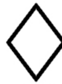
Alte materiale Other materials Autres materiaux Otros materiales Sonstiges material