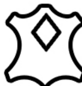
Piei cu fata corectata Coated leather Cuir enduit Cuero untado Benchichtetes leder